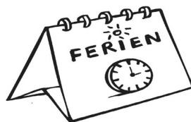
Auch das Pfarrbüro macht Ferien.

Für seelsorgerische Angelegenheiten sind Pastor und Gemeindefereferent wie gewohnt zu erreichen